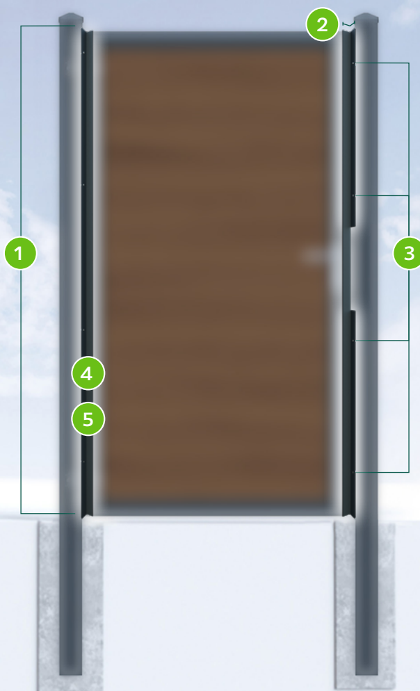
Beispielgrafik: Blickdicht-Winkel Band- und Anschlagwinkel